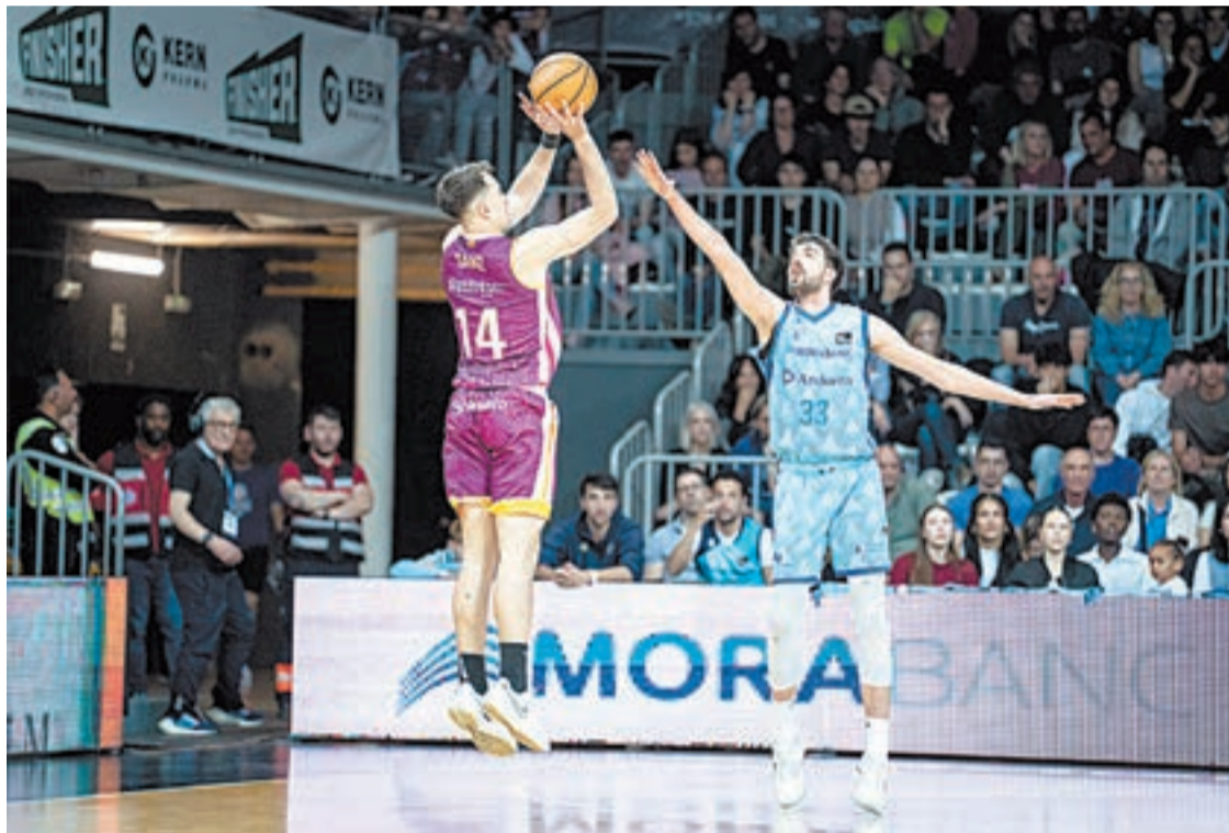
El jugador bordeus executant un llançament a Andorra

L'acció és exclusiva per als abonats i abonades del conjunt lleidatà i consisteix en un 15% de descompte en les entrades, segons va informar l'entitat. El funcionament de l'oferta és el següent: Cada abonat o abonada podrà adquirir dues entrades per al partit del diumenge (17.00 hores) contra l'UCAM Murcia amb un 15% de descompte del preu general. La promoció estarà disponible fins a exhaurir les entrades. Les entrades es poden adquirir a través