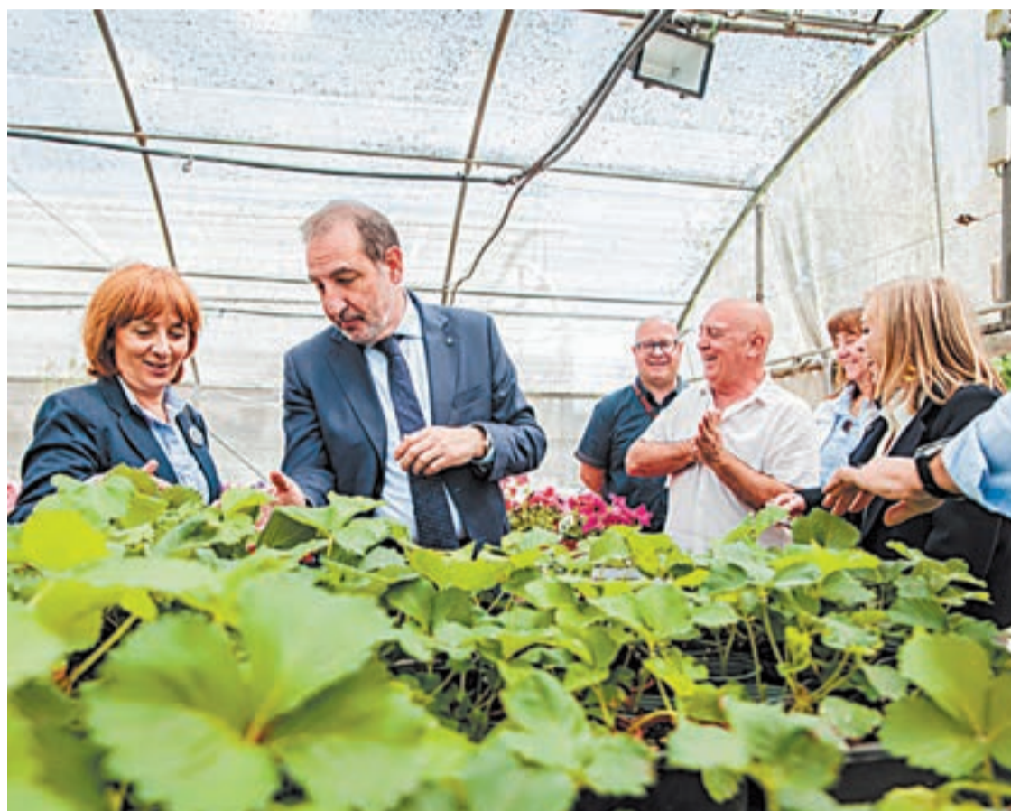
El conseller Espadaler de visita al centre de justícia juvenil de Lleida

El titular del Departament, Ramon Espadaler, va visitar ahir dimecres el centre, on va mantenir una reunió amb l'equip directiu. Actualment, al centre hi ha 30 joves que compleixen alguna mesura judicial d'internament. Aquest 2025, la conselleria està acabant les obres del projecte 'Viu en digital!' i