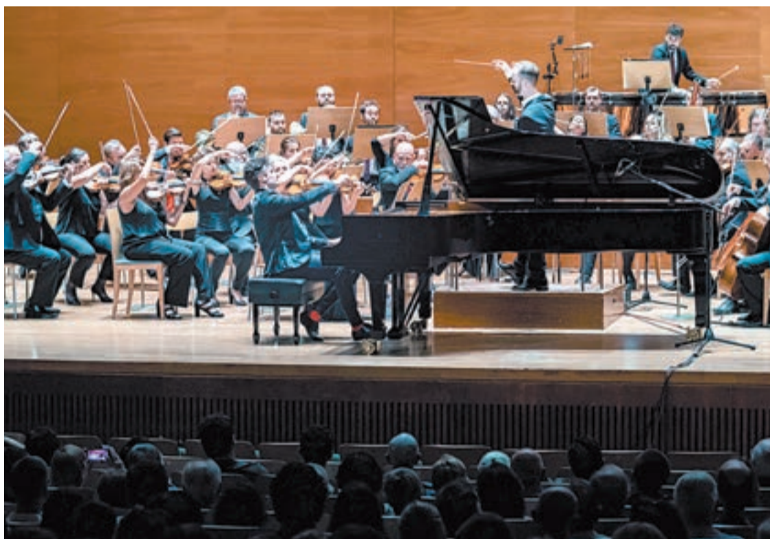
Imatge de la final de l'anterior edició a l'Auditori, l'any 2023

El jurat seleccionarà els finalistes, que faran les proves del 24 al 28 de juny