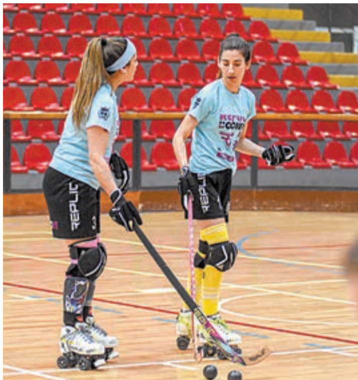
FOTO_ CP Vila-sana L'equip s'enfrontarà a l'Aberastain