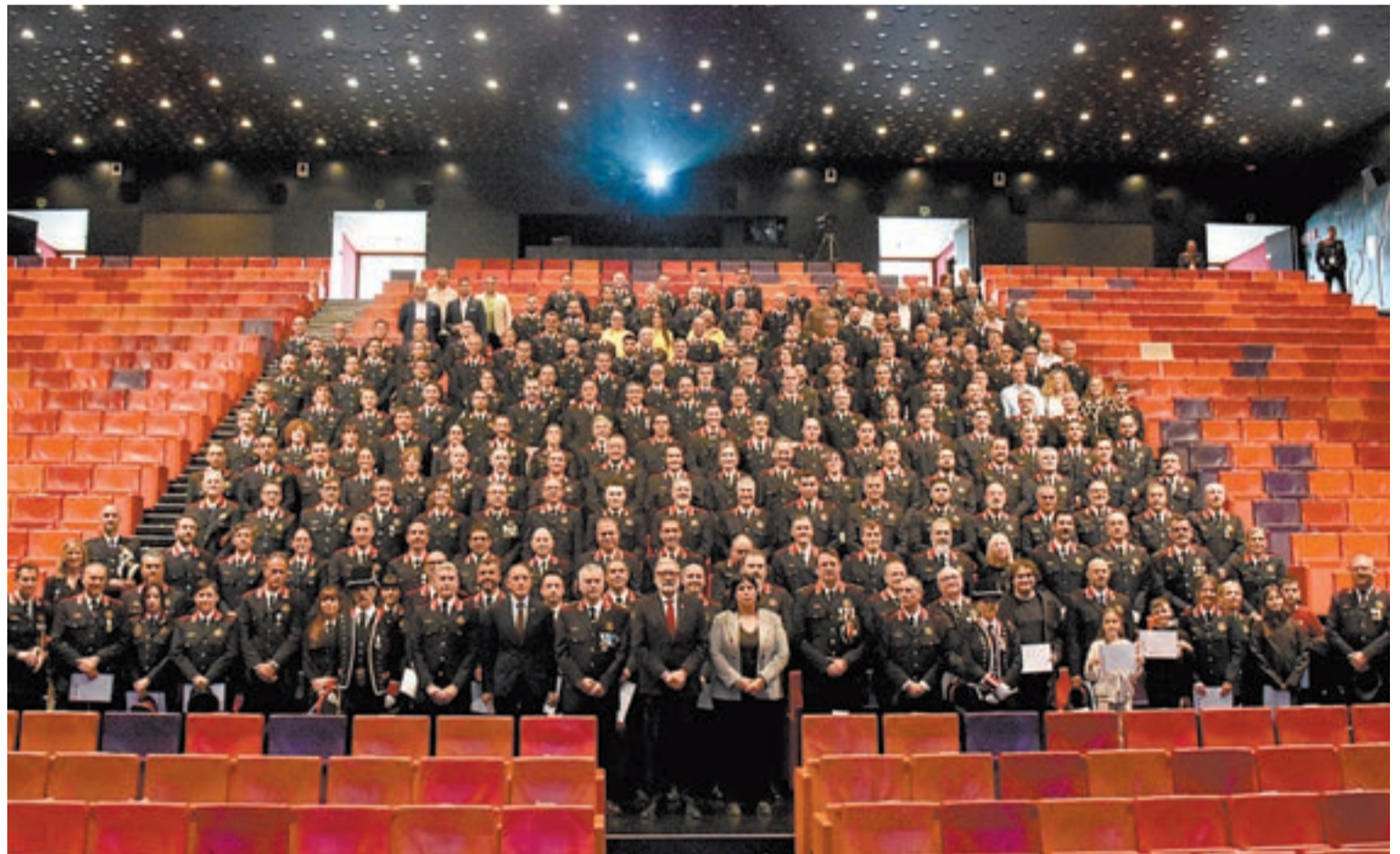
Els mossos i els ciutadans que van ser distingits durant el Dia de les Esquadres

Per la seva banda, el sindicat USPAC va exigir ahir el cessament del cap de