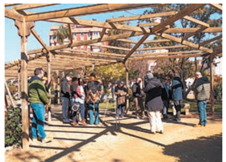
El festival vol fomentar la creativitat