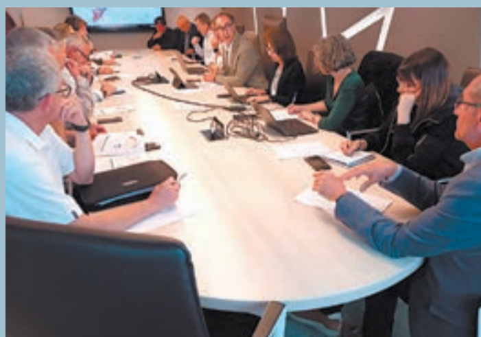
FOTO_Govern Un moment de la reunió del Govern amb organitzacions agràries i Agroseguro celebrada ahir

El Govern va analitzar ahir amb les organitzacions agràries i Agroseguro l'impacte sobre les comarques de Lleida de la pedregada que va caure el 19 d'abril, i que l'organisme que ofereix la cobertura d'assegurances considera que no va ser un "gran sinistre". A la reunió, Agroseguro va