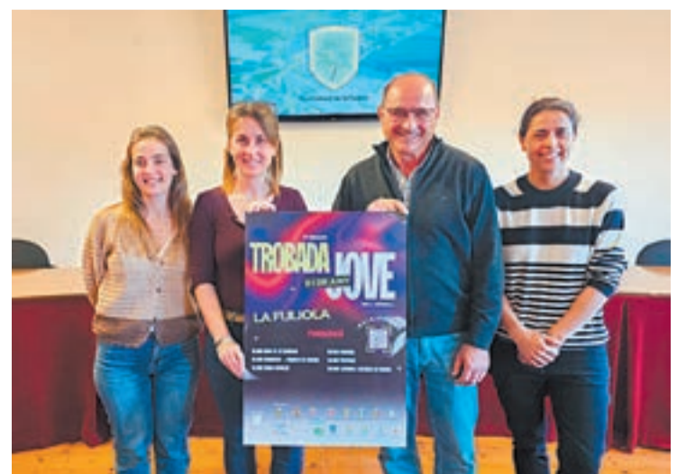
La jornada tindrà lloc el pròxim 21 de juny i inclourà diverses activitats

La Fuliola acollirà el 21 de juny la 7a edició de la Trobada Jove de l'Urgell a l'espai de l'Era Segar i Batre. La trobada començarà amb un esmorzar, seguit d'un torneig de beisbol i al migdia s'oferirà un dinar popular. A la tarda, hi haurà una gimcana i per acabar, una entrega de premis.