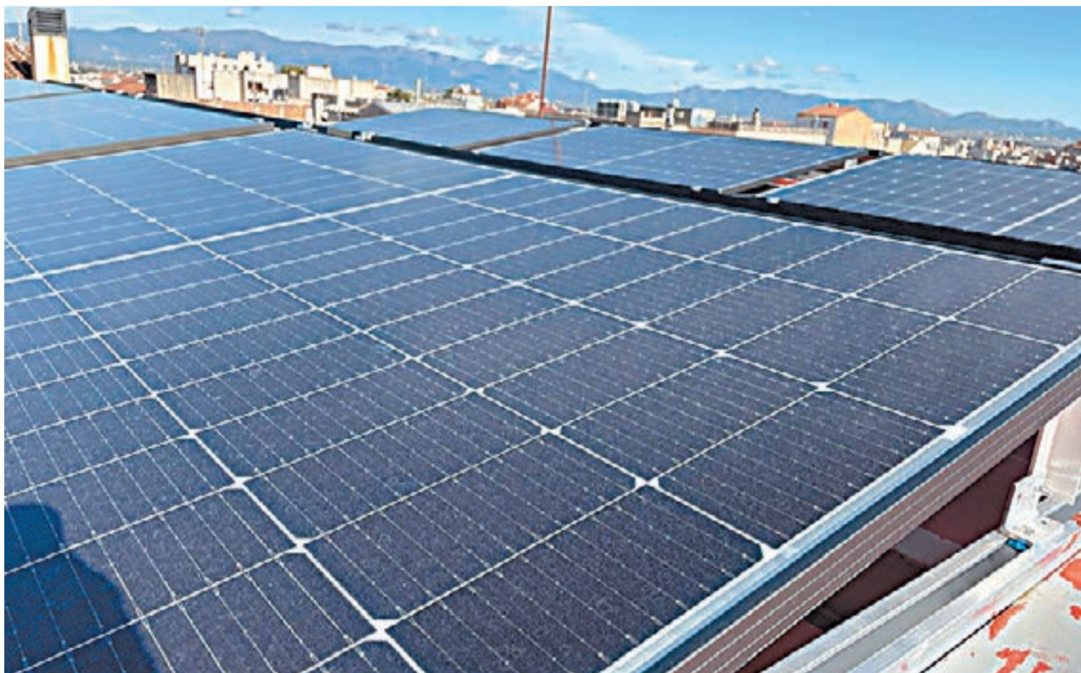
L'energia fotovoltaica solar es va reduir en 9.813 megawatts, però es va mantenir en funcionament