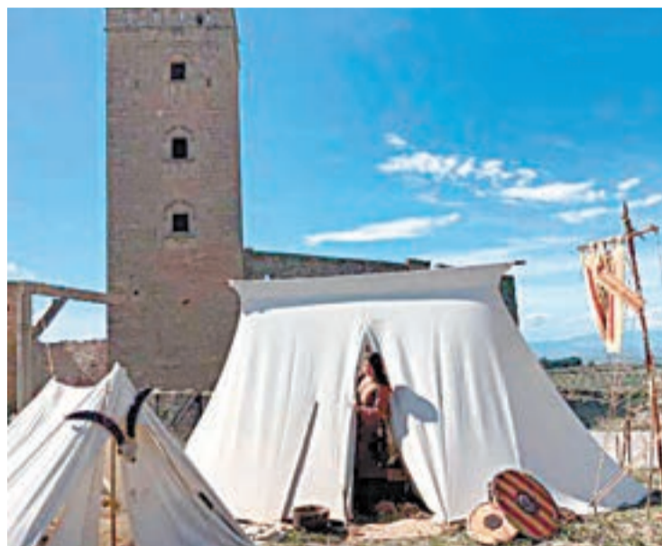
Campament medieval

Arriba la 23a edició de Ciutadilla Medieval, la trobada de Grups de Recreació Medieval, que torna un any més amb un programa ple de propostes entre les que no hi faltaran com és habitual cada any la Taverna del Castell, la recreació de la vida en un campament medieval, tallers, música en directe o la pujada de torxes al Castell, entre altres que és poden veure al programa que acompanya aquestes línies. El certamen se celebra del 3 al 5 de maig