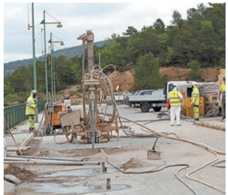
Operaris treballant a Rialb