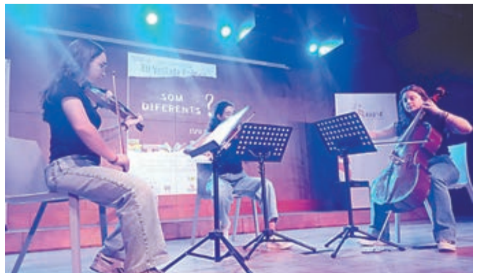
Concert de violí a la Vetllada Poètica celebrada dimarts

reunir-se a l'icònic espai de Lleida per celebrar una jornada entre el veïnat del barri, envoltats del luxe i menjar de la Fonda del Nastasi.