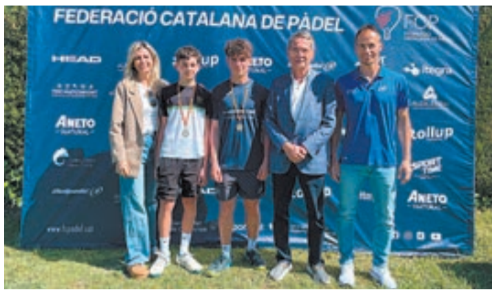
FOTO_ CT Lleida El CT Lleida va acollir el torneig