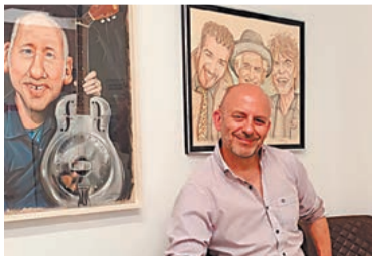
L'artista amb alguna de les seves obres