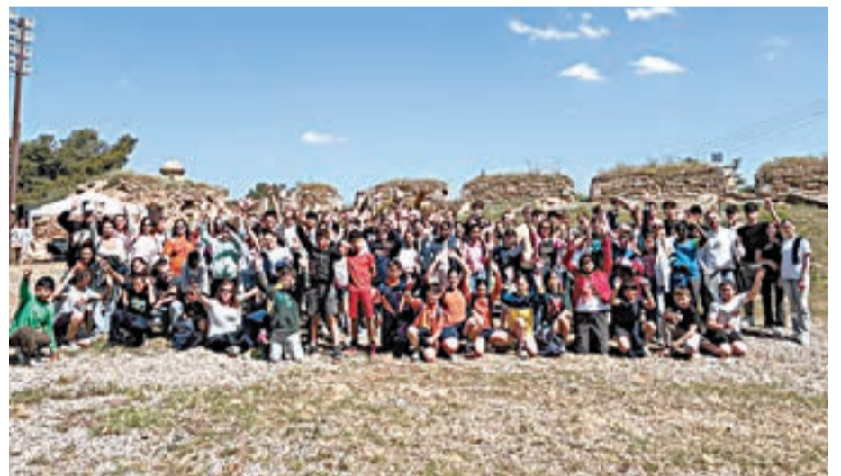
Els gairebé 100 joves i infants al Castell de Gardeny

toris. Gelabert va interpretar amb l'alumnat d'infantil i primer cicle de Primària alguns dels seus 'hits' com 'Abecedari' o 'Mou el cos'.