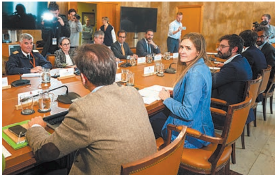
La ministra Sara Aagesen va presidir la reunió del comitè d'investigació de l'apagada

Fonts del Ministeri de Transició Ecològica, que