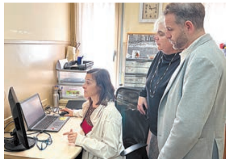
FOTO_ La Paeria Valls i Blanco a l'oficina del Clot

envolupant l'activitat, que es du a terme els dimecres i divendres al matí. Simultàniament, hi ha un altre punt d'atenció al Centre Cívic del Secà, que opera els dimarts i els dijous, i arriba també a Llivia. L'Oficina ja ha estat a la Mariola, Rambla i Casc Antic.