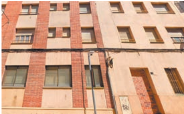
Façana de l'antic convent de les Josefines

“Som un barri molt solidari, ja tenim residències per a la tercera edat, tenim