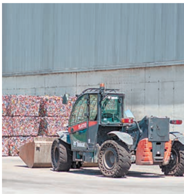
Planta de tractament de Griñó a Montoliu

El Grup Griñó ha finalitzat el procés d'optimització tecnològica de la seva Planta de Selecció d'Envasos Lleugers de Montoliu de Lleida, aconseguint augmentar la capacitat de tractament un 25%, de 12.000 a 15.000 tones anuals i incrementant en un 10% la recuperació de materials. Seguint el compromís del grup amb la sostenibilitat i l'economia circular, aquesta actualització ha millorat de manera substancial tant el rendiment del procés com la qualitat dels materials recuperats. El procés d'optimització ha suposat una inversió de 1,5 milions d'euros. Des de la seva posada en marxa l'any 2003, Grup Griñó gestiona la Planta de Selecció d'Envasos Lleugers de Montoliu de Lleida, dedicada a la