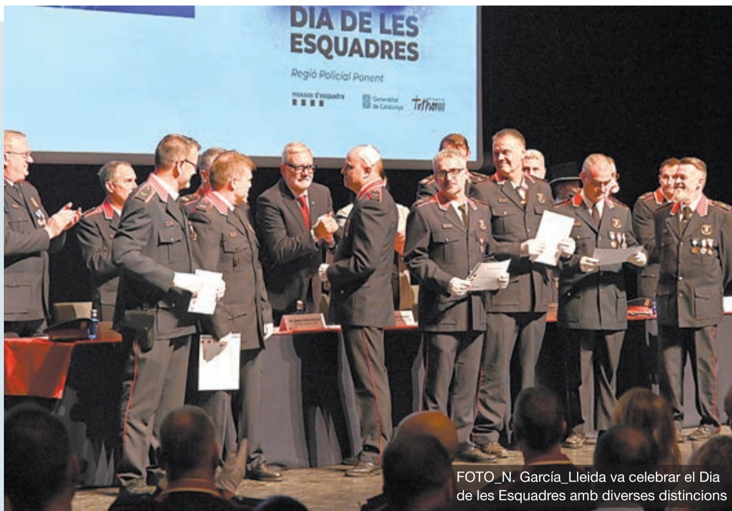
Lleida va celebrar el Dia de les Esquadres amb diverses distincions

Moncloa inspeccionarà les elèctriques per descartar que hagin rebut un atac P.3-9