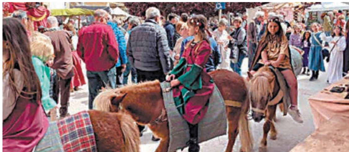
Unes nenes passen en poni per Ciutadilla