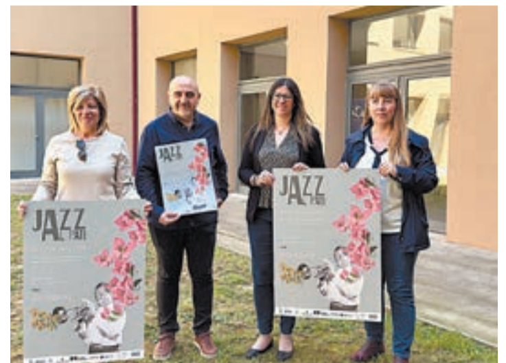
La Mostra comença el dia 14

El jurat seleccionarà 18 pianistes per participar en les tres proves presencials públiques, del 24 al 28 de juny, a l'Auditori Enric Granados. La final serà oberta al públic i tindrà lloc el 28 de juny (19.00 hores).