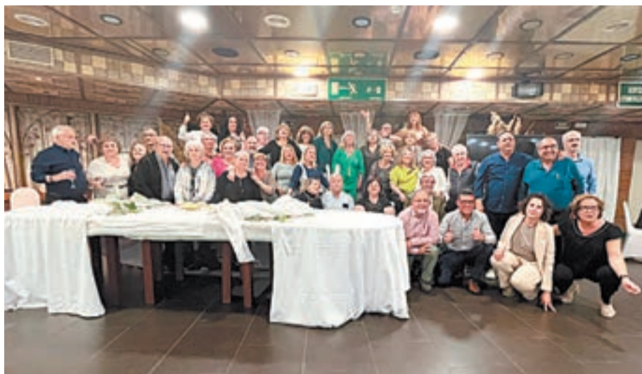
Els integrants de l'entitat Arrels de la Mariola al Nastasi

ció és millorar l'experiència del pacient. El nou edifici serà dissenyat amb l'objectiu de crear un entorn assistencial d'avantguarda, modern però acollidor, on s'agilitzaran els processos mitjançant la implementació de tecnologies d'intel·ligència artificial i eines que ajudin a fer més confortable l'experiència d'usuari", van destacar.