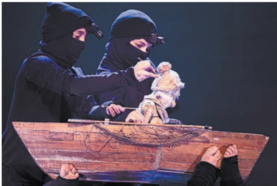
FOTO_S.B. La companyia sud-americana presentarà l'obra 'Pescador' a la Llotja

Entre les companyies participants hi ha 10 internacionals, 10 catalanes i 8 de la resta de l'Estat, destacant la presència de tres lleidatanes: Campi Qui Puguí, que farà l'estrena absoluta de 'Camelva'; Arnau