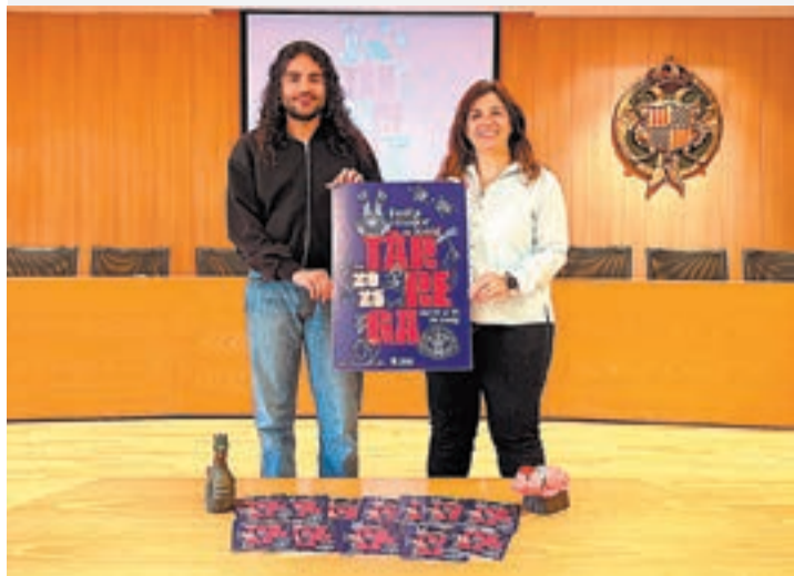
FOTO_ Aj. Tàrrega Presentació del programa d'actes