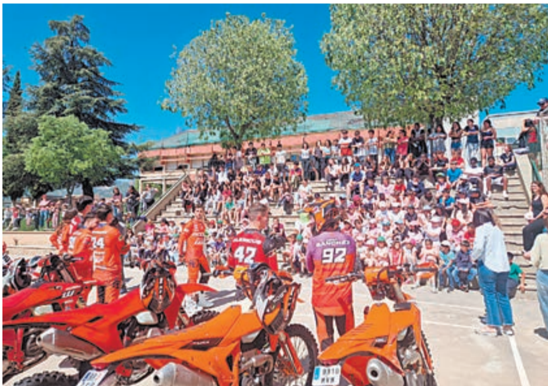
Activitat prèvia en l'Institut Escola d'Oliana

L'espai neuràlgic de la cursa s'ubica al centre de la població, al costat de l'Ajuntament d'Oliana, on hi haurà el parc tancat i el paddock. Serà aquí on es doni el tret de sortida al Mundial, el divendres, amb el Super Test. La prova començarà a les 17.30 hores i el públic podrà viure l'emoció de la lluita pel millor temps. Els pilots realitzaran el circuit en paral·lel, de dos en dos. Durant el cap de