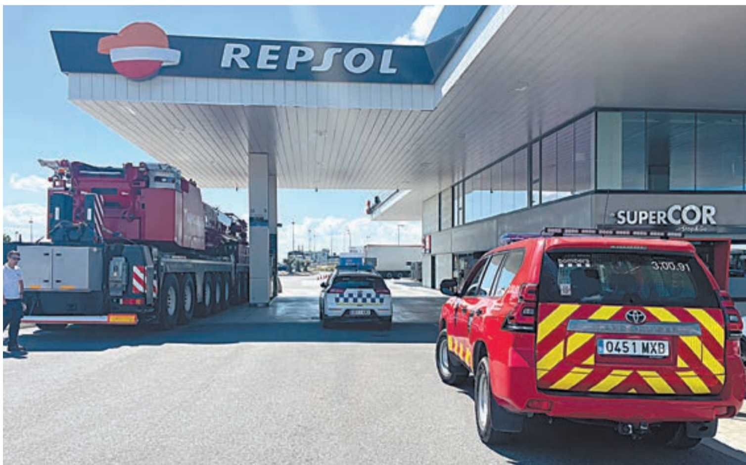
La feina dels Bombers va ser essencial (a la imatge, un dels seus vehicles repostant dilluns a Lleida)

Els Bombers de Balaguer expliquen com va anar el rescat de gent atrapada als ascensors i l'assistència als padrins de les residències