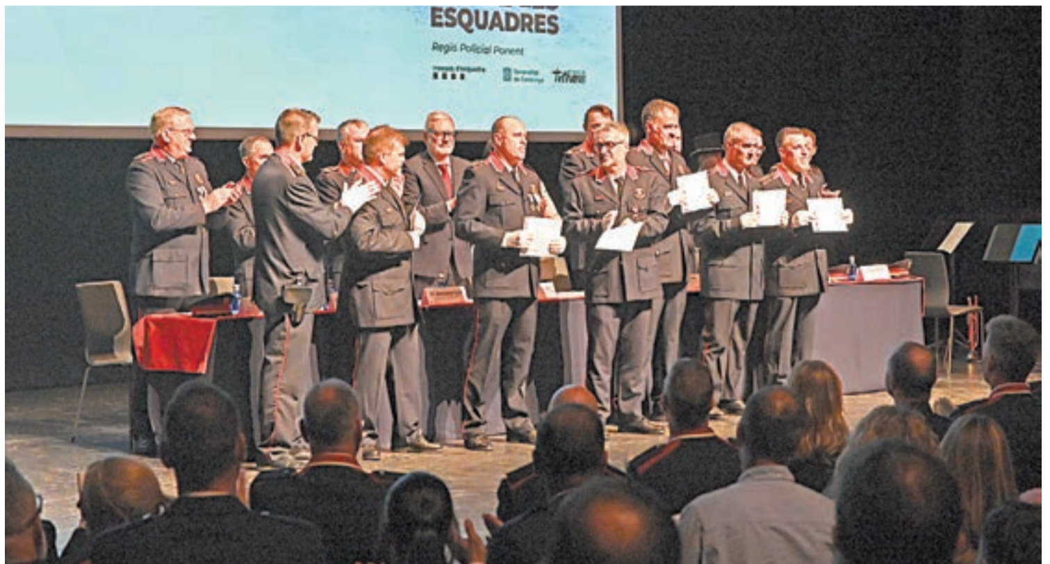
Els assistents a l'acte es van posar de peu per ovacionar l'agent de l'ARRO agredit

Durant el primer trimestre d'enguany, els delictes contra les persones s'han reduït un 4% a Ponent, però els delictes contra el patrimoni s'han incrementat un 6%, en especial els robatoris a l'interior de vehicles, que han repuntat un 90%.