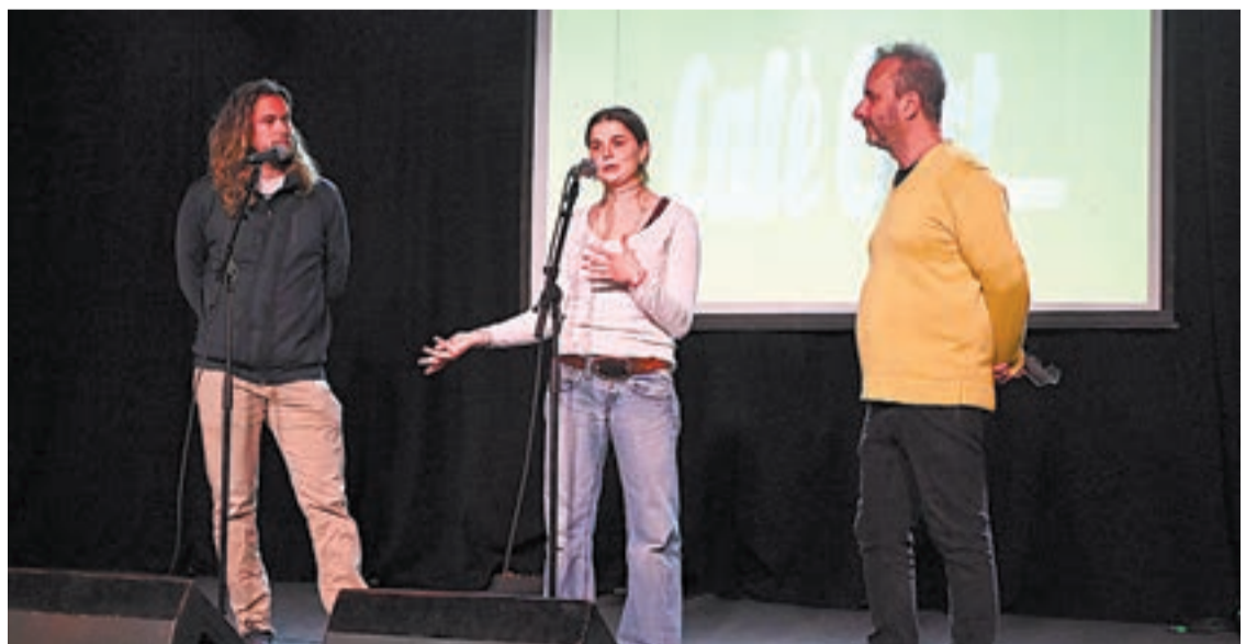
Es van projectar peces de videodansa i curt amb aquesta temàtica

La llibreria Irreductible que aplega un conjunt de caricatures de diverses figures del món de la cultura, la política i l'espectacle.