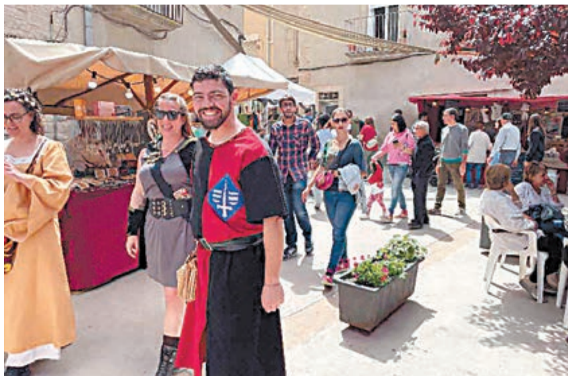
Imatge d'una edició anterior de la fira