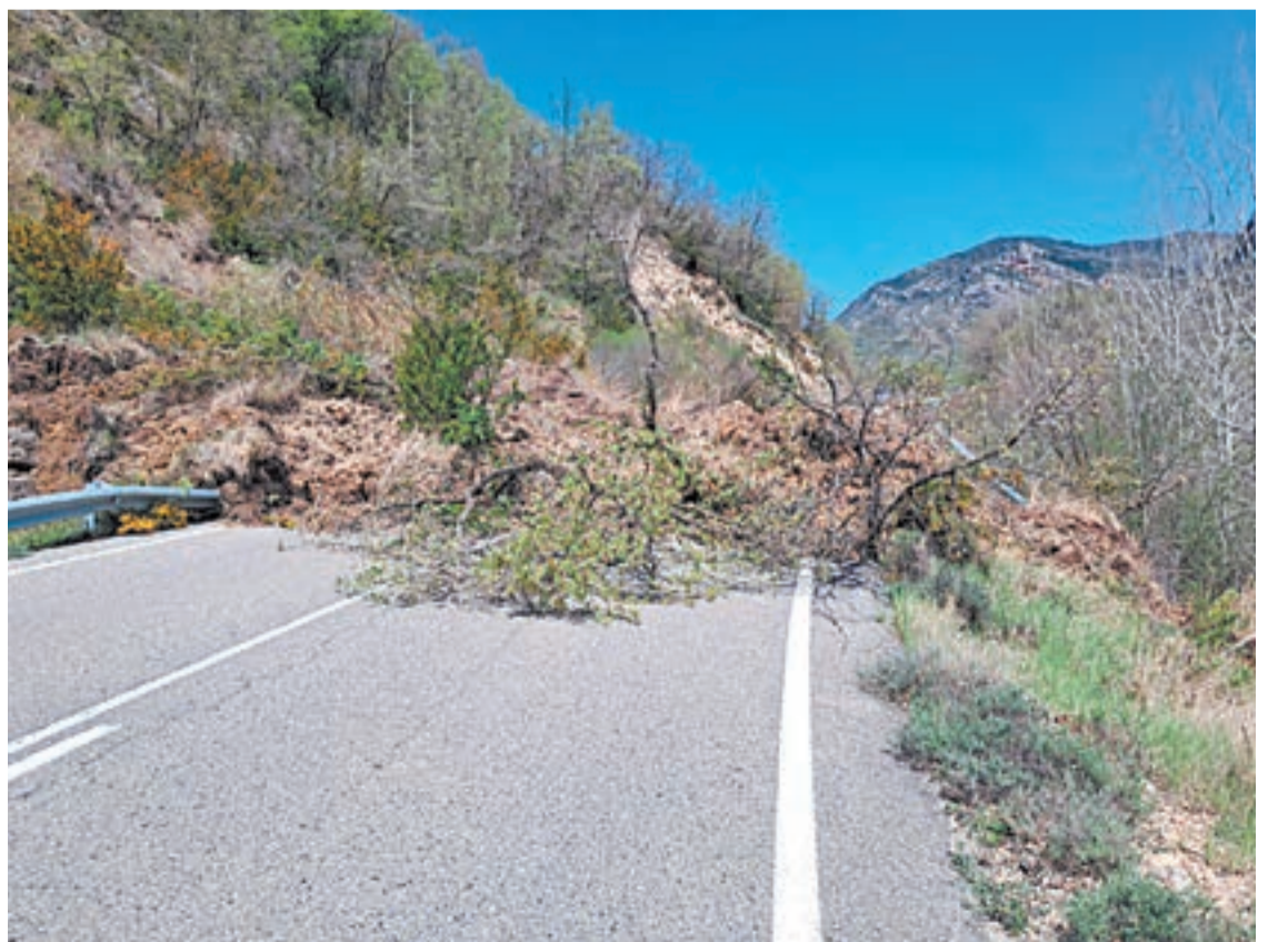
Punt on es va produir l'esllavissada a l'A-1605 a la Ribagorça aragonesa

A més, la Diputació finançarà un servei de seguretat privada i aportarà en total 600.000 euros per ajudar els ajuntaments a cobrir les despeses corrents derivades de l'activitat agrària i reparar les infraestructures municipals.