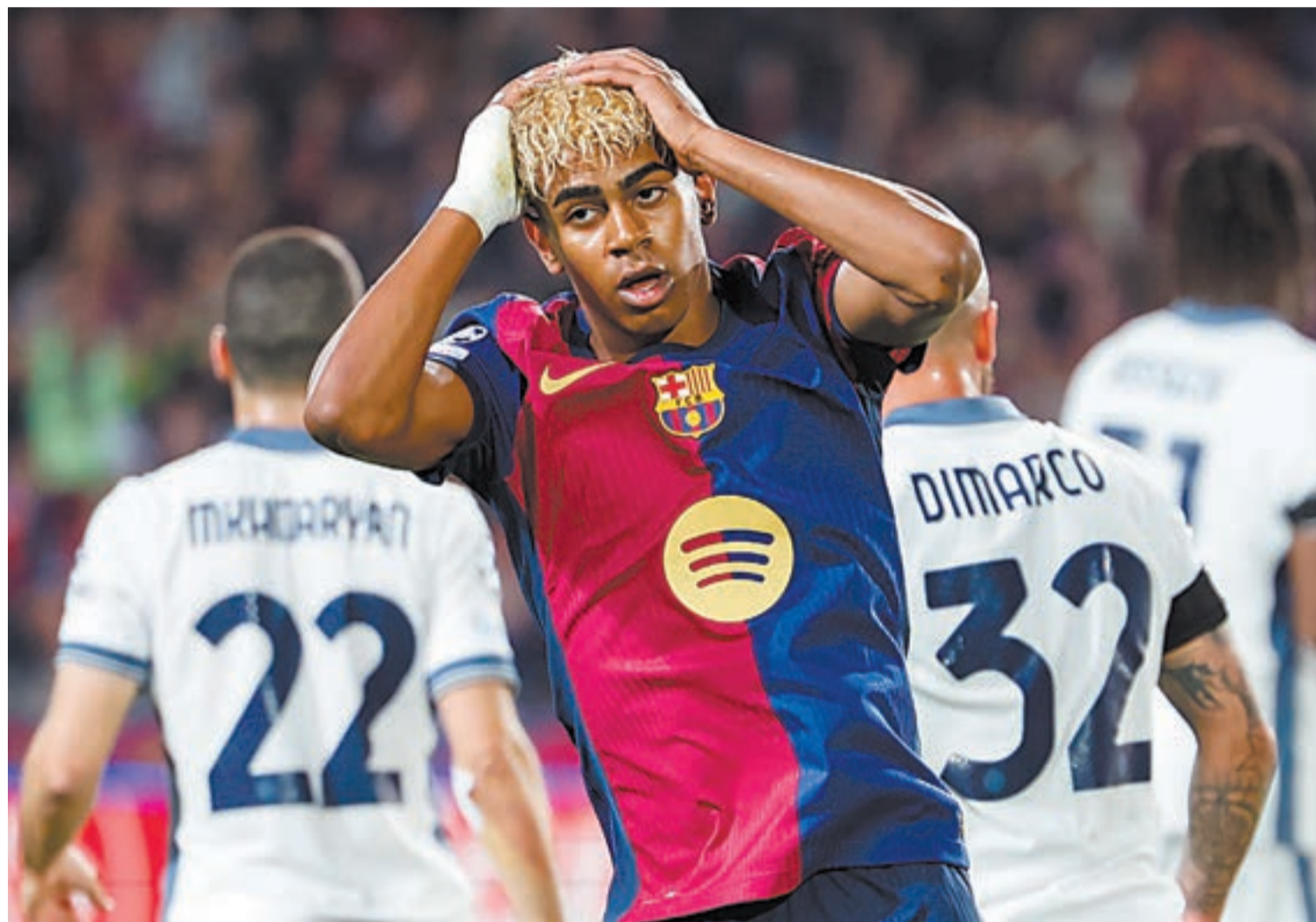
El davanter blaugrana Lamine Yamal, que va arribar als 100 partits, lamenta una de les ocasions

Va haver de remuntar el Barça un 0-2 i un 2-3. L'empat va ser un premi a la persistència dels blaugrana i a la punteria de l'Inter. La trobada ho va tenir tot, també un protagonista esperat: Lamine Yamal, que va anotar un gol en el seu partit cent com a barcelonista, amb només 17 anys i 291 dies. Va ser un exercici de pun-