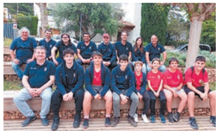
El Mollerussa va tindre 16 jugadors

B. El Tàrraga, a Primera, va quedar sisè; i el Mollerussa C va ser vuitè, en el que va destacar Jordi Capdevila, amb 6 punts en 8 partides. El Mollerussa D (Segona) va ser desè. El Lleida D (Tercera), va ser setè i el Mollerussa E va quedar en novè lloc.