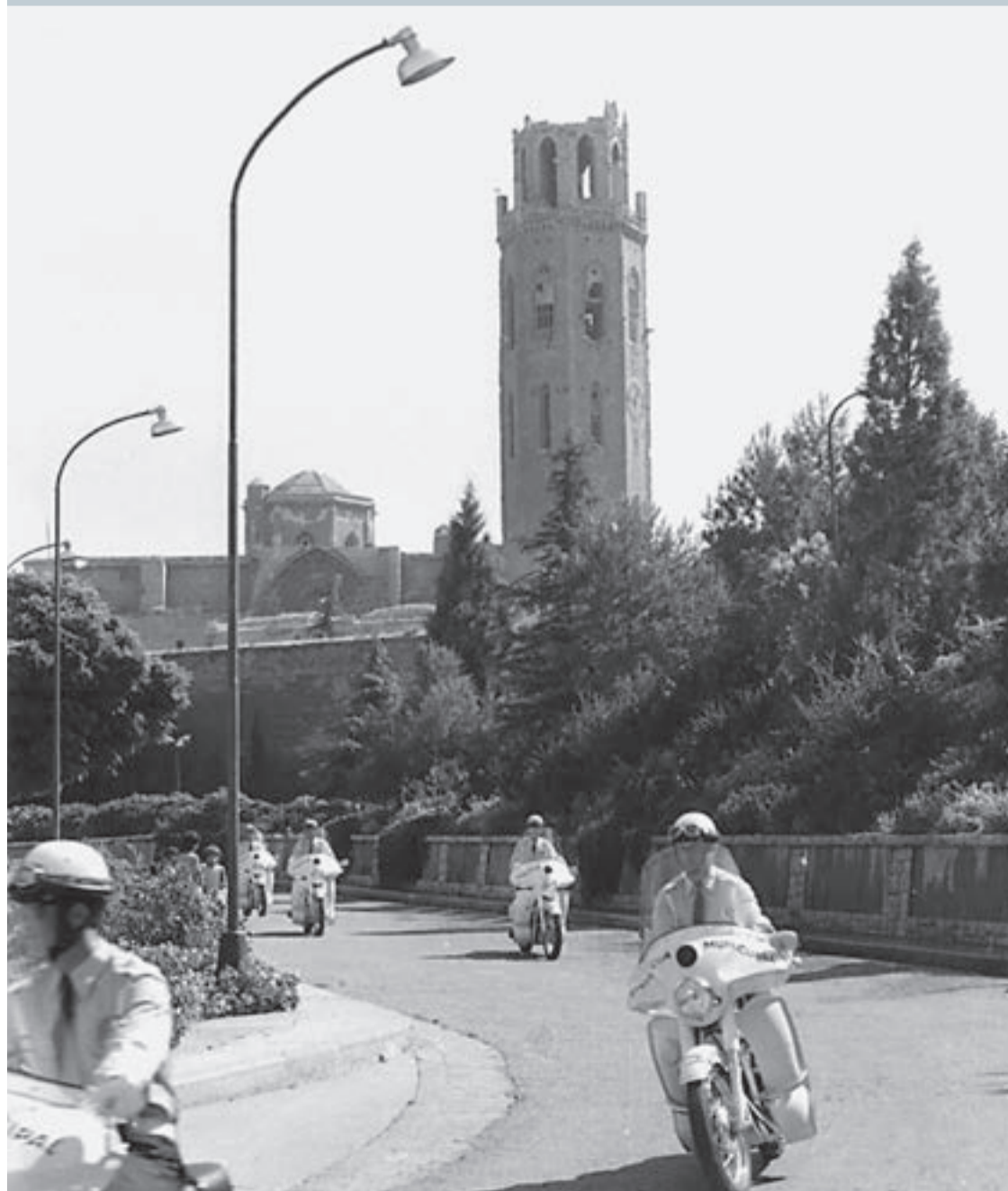
Agents motoritzats de la Urbana al Turó de la Seu Vella (sense datar)